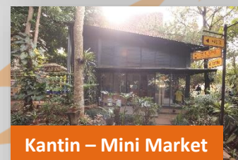
Kantin – Mini Market