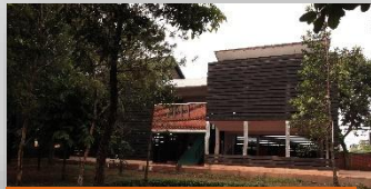
Ruang Kelas Terbuka